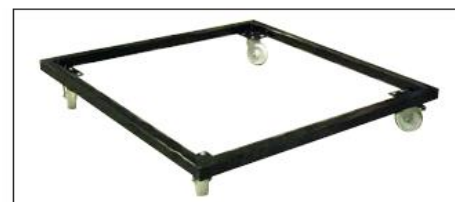
Chariot de transport pour plateaux : capacité 20 à 25 plateaux, dimensions extérieures : 130 x 130 cm tube 5 x 5 cm