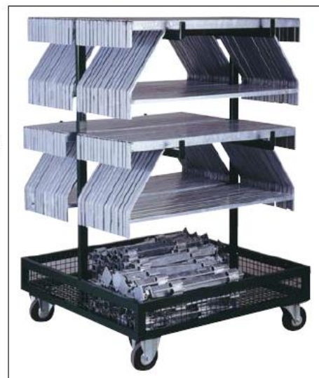
Chariot de transport pour structure podium (60 entretoises + 30 pieds), dimensions : 130 x 130 x haut. 180 cm.